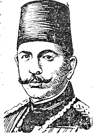
Abbas Hilmi Paşa

babasının ölümü üzerine on sekiz yaşında Hidiv oldu. Kırk yıl hükümdarlık eden Abbas Hilmi Paşanın değişmez politikası, Türkiyeye karşı mutlak ve samimi bir sadakat olmuştu. Birinci Cihan Harbine gelinceye kadar bu ailenin bütün âzası gibi, İstanbulun hayranlarındandı. Hemen her yıl bir Avrupa seyahatine çıkar, bilhassa Fransa ve İsviçrede kalır, yaz mevsiminin büyük bir kısmını da İstanbulda geçirirdi. "Valide Paşa" ünvanıyla İstanbulun büyük şöhretlerinden olan anası, Bebekteki sahilsarayda otururdu; Abbas Hilmi Paşa da Çubukluyu sevmişti. Kendisini İstanbul'a getiren Elmahrusa adındaki