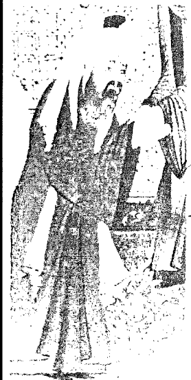
ABBAS bin ABDÜLMUTALİB İst. Üniversite kütüphanesi