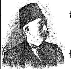
ABBAS HİLMİ PAŞA