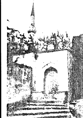
ABBASAĞA camii Beşiktaş, İstanbul

ABBASI altını , Nümisim. Safevî hükümdarı Şah Abbas I zamanında (1587-1628)