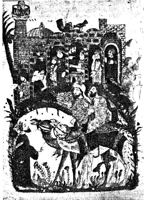
Hariri'nin Makamât adlı kitabından Vasiti'nin bir minyatürü, 1237, Ulusal Kitaplık, Paris Bibliothèque Nationale, Paris

Bağdat Paktı, Türkiye, Pakistan, Irak, İran ve İngiltere'nin oluşturduğu karşılıklı güvenlik ve savunma örgütü. Merkezi Bağdat'ta olmak üzere 1955'te kurulmuş, 1959'da da adı Merkezî Antlaşma Teşkilatı(*) (CENTO) olarak değişmiştir.