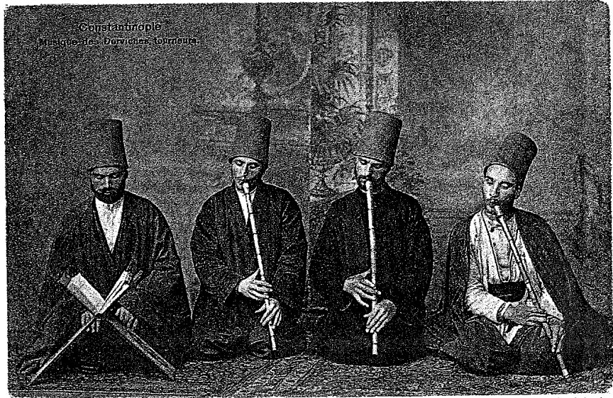
Ekrem Işın Arşivinde

XVII. yüzyılda Mevlevîlik, Anadolu, Balkanlar ve Akdeniz coğrafyasını kuşatan geniş çaplı bir örgütlenme ağına sahiptir. Bu sayede Osmanlı dünyasının farklı alanlarına nüfuz edebilen tarikat, yayıldığı bölgelerin uygarlık birikimlerini, İstanbul'un üst ve orta tabakaları arasındaki kültürel dolaşıma aktarma işlevini üstlenmiş, dolayısıyla şehrin gündelik hayatını şekillendiren başlıca dinamiklerden birisi durumuna gelmiştir. XVII. yüzyıla kadar İstanbul'daki faaliyet merkezlerini Galata ve Yenikapı mevlevîhâneleriyle sınırlı tutan Mevlevîliğin bu yeni dönemde, artık bir imparatorluk tarikatı olarak üstlendiği dinamik role uygun örgütlenme modelini şehir ölçeğinde yaygınlaştırmaya başladığı görülmektedir. Bu model ana hatlarıyla, güçlü şeyh ailelerinin denetiminde gelişen çok merkezli bir idari yapılanmayı kapsar. Beşiktaş, Kasımpaşa ve Üsküdar mevlevîhâneleri böyle bir yapılanmanın gereği olarak kurulmuşlar, XVII. yüzyıl ortalarından itibaren tarikat içinde güçlenen şeyh aileleri de bu dergâhların ortak yönetimlerini ele geçirmek suretiyle İstanbul Mevlevîliğinin sosyo-kültürel temellerini atmışlardır.