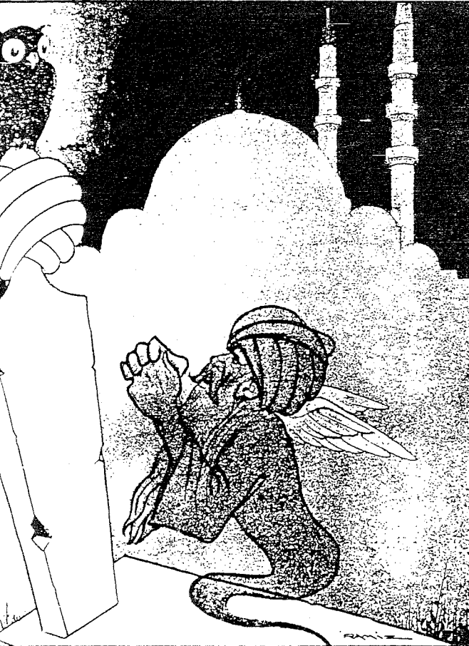
AKBABA Dergisi - (1935) S. EYİCE'nin Arşivinden

Prost, şu eserde : Académie d'Architecture, Revue de Henri Prost, Architecture et urbanisme , 1920, s. 15 (Büyüksaray'ın plan ve restitüsyon), (Büyüksaray'ın ekolojik park planı).