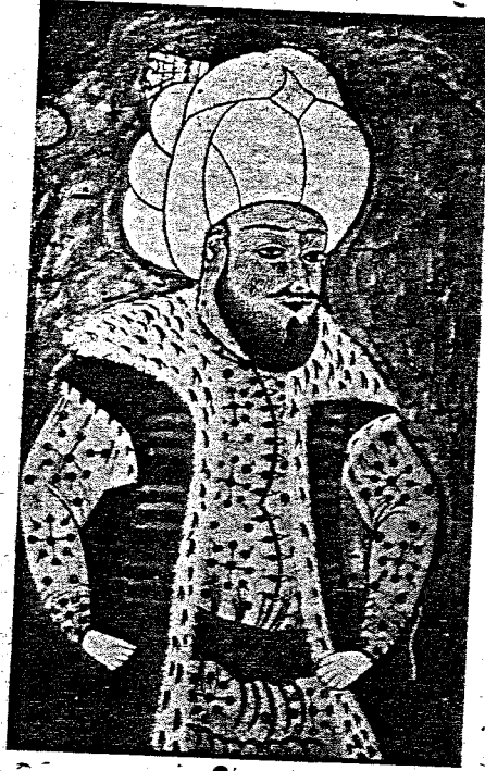
Gebzeyi imar eden Fatih İkinci Sultan Mehmet Hammer de Gebzenin eski Libyssa olduğunu kabul etmiştir (3).

Milâdın ilk yarısında yaşayan Plutark "Biden de deniz sahilinde yerlilerin Libisa dedikleri bir köy vardır. Rivayet olduğuna göre şu: