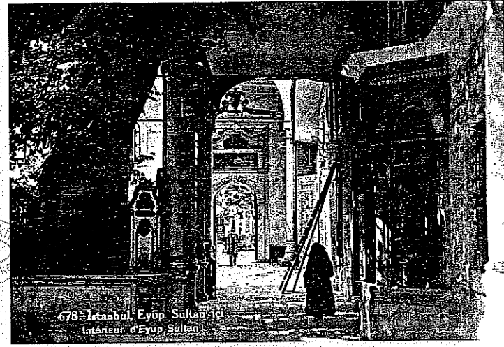
✦ Eyüp Sultan Camii'nin iç avlusu ✦ Eyüp Sultan Camii'nin avlu kapısı

İstanbul Üniversitesi Edebiyat Fakültesi Tarih Bölümü'ne başladığımızda kıymetli bir hocamız, "Osmanlı Arşivi engin, ucu bucağı olmayan bir denize benzer. Biz bu engin denize dalıyor, bulabildiğimiz ne varsa çıkarıyor ve eserlerimizi o şekilde veriyoruz." demişti. Bu ifadeler, üzerinden 23 yıl geçmesine rağmen, hâlen tesirini ve sıcaklığını muhafaza etmeye devam ediyor. Bizler de hocalarımızın tavsiyeleriyle, Osmanlı Arşivi'nin engin sularında kulaç atmaya başladığımızdan beri, nice