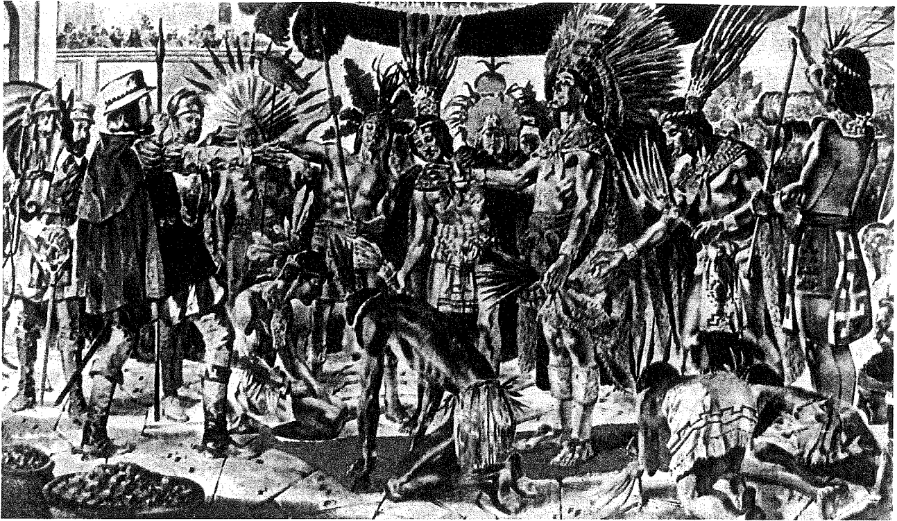
التقاء امبراطور الأزتيك «مونتيزوم» و«هرنان كورتيز» في الطريق إلى العاصمة تينوشيتلان

وأن العالم دمر في أربع مناسبات. أما أهم الآثار التي حفظت إلى اليوم إلى جانب التقويم المذكور والأهرامات فهي: مخطوط يمثل الملك أكسيكااتل على عرشه متدنياً بجلد ثمر قرب هرم مدرج (محموظ في المكتبة الوطنية بباريس)، وقناع جنائزي يمثل رب الليل (محموظ في المتحف البريطاني)، وتمثال من فخار يمثل وجه محارب، وتمثال رب الربيع والأزهار وأمامه المذبح، ومقبض مديدة القرابين مطعم بالفيروز واليشب والزجاج الصخري.