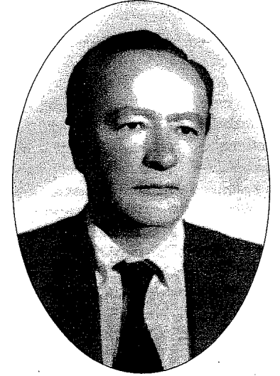
“Bir cemiyetin bir âdetinin doğru değildir diye bozulması halinde orada artık âdet ve örf değil, cemiyet bile ortada kalmıyor.” (Erol Güngör, 1979)

Hayatı, şahsiyeti, sosyal ilişkileri ve yapıtları gözönüne alınarak, Güngör hakkında iki ayrı yoruma gidildiği söylenebilir. Bu yorumlardan birincisi Güngör’ü, özellikle 80’li yıllardaki milliyetçi ideolojinin “gözükmeyen” ve fakat buna rağmen önde gelen bir temsilcisi olduğu şeklindedir. İkinci yorum, Güngör’ü 90’lardaki İslâmcı yenileşmeye bağlı olarak milliyetçi ideolojinin dinsel vurgularının artmasına ya da en azından milliyetçi ideolojinin sınırlanmasında dinsel hâkim bir unsur olarak öne çıkartılmasında etkin bir isim olarak öne çıkartmaktadır. Burada Güngör’e İslâmcı çevrelerden de yönelik bir teveccühün başladığı söylenebilir. Güngör’ün, 1980’li yılların başında akademik birikimine kısmen de kişisel siyasal bağlanmalarına dayalı bir milliyetçilik çizgisi izlediği bilinmektedir. 90’lı yıllarda Erol Güngör, bu milliyetçiliğin yerini dinsel hâkimin aldığı, en azından milliyetçiliğin önemli bir ögesi olarak dinsel hâkimin belirlediği yeni bir yönelimin temsilcisi olarak yeniden hatırlanır. Hemen belirtmek gerekir ki, aslında