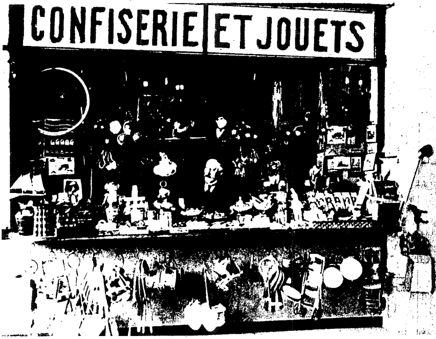
Méliès, sinemacılığı bıraktıktan sonra, unutulup gitmiş, Montparnasse garında, bu şekerleme ve oyuncak dükkânını açmıştı, ömrünün son yıllarında burada keşfedildi ve hakkettiği itibara kavuştu.