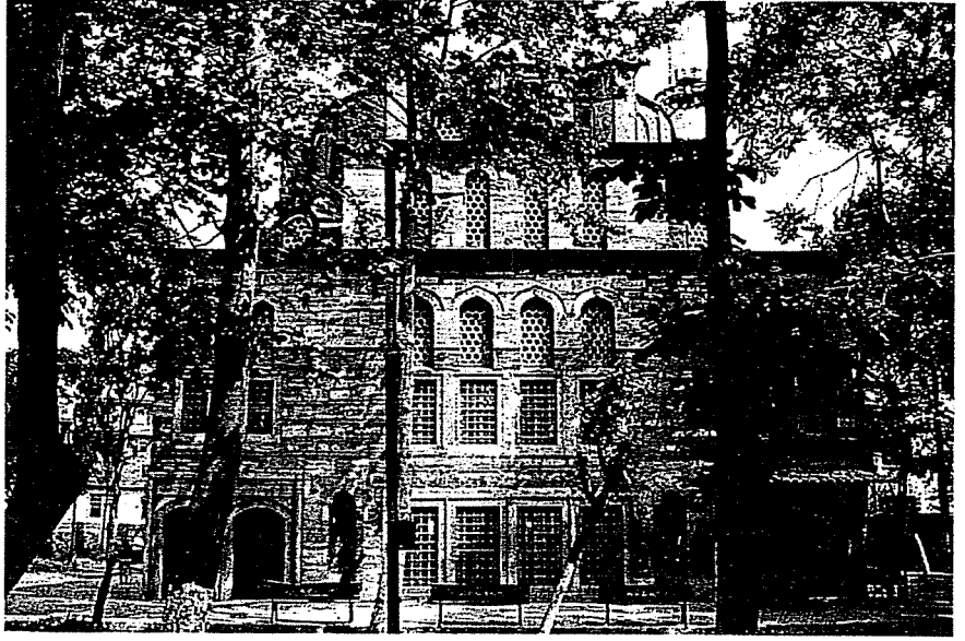
İvaz Efendi Camii

İvaz Efendi Camii, 15,60x14,50 m boyutlarında, kareye yakın dikdörtgen planlı bir yapıdır. Mihrap kısmı, kible yönünde, dikdörtgen bir çıkıntı yapmaktadır. Ca-