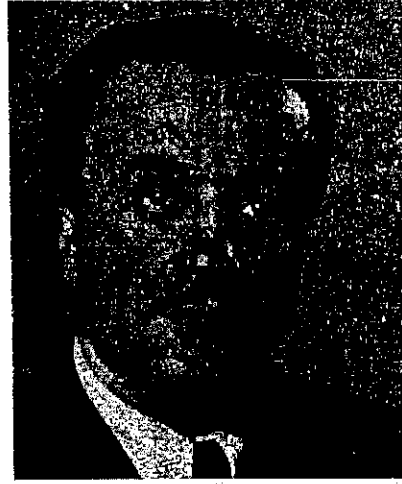
Necip Fazıl Kısakürek

NECİP FAZIL’IN YARATTIĞI LOZAN MİTOSU, BAŞKA İSLAMCI FİGÜRLERİN KATKILARIYLA TEDAVÜLDE KALMAYA DEVAM ETMİŞ VE BUGÜNLERE KADAR GELMİŞTİR.