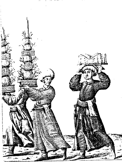
Küçük nahıllar ve cibinlik içinde gelin (Viyana Nat, Bibl. Cod. 8626)