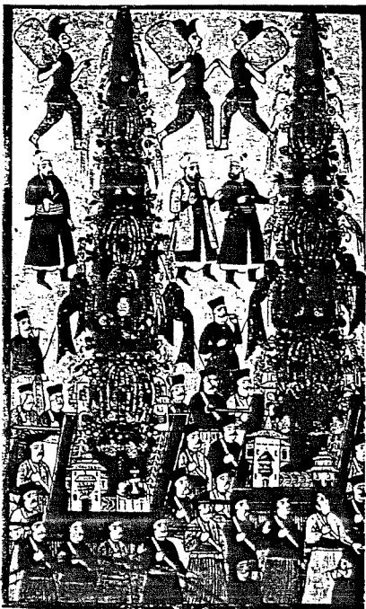
Levni'nin çizimiyle 1720 şenlikindeki dev nahılların göha Metin And'ın resmi

Osmanlı İmparatorluğu'nun en zor ve en hassas döneminde görev yapan Nahum, Fransa'ya ve Fransız kültürüne olan yakınlığıyla bilinmesine rağmen cemaatin ve ülkesinin menfaatleri için Amerikan diplomatik çevrelerine de girmeyi başarmıştır. 1909-1917 arasında Amerika Birleşik Devletleri'nin üç Yahudi büyükelçiyi İstanbul'a atamasının, Nahum'un bu ülke diplomatik çevreleriyle kurmuş olduğu iyi ilişkilerin bir neticesi olduğu bilinmektedir. Bu ilişkiler Osmanlı yönetiminin dikatini çekti. Nahum'un Amerika büyükelçisi olarak tayin edilmesi birkaç kez gündeme geldiği de bu gerçekleşmedir. Nahum'un hahambaşılık görevi öncesinde, sırasında ve sonrasında sarayla ve hükümet yetkilileriyle kurmuş olduğu ilişkiler 1910'da kendisine mebusluk teklif edil-