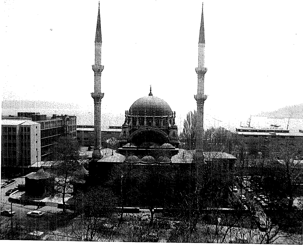
■ Nusretiye Camii

Alçı mihrap çok sade olup, mukarnaslı bir yaşmağa sahiptir. Ahşap minber, ampir özellik göstermektedir. Vaaz kürsüsü ise özelliği olmayan basit bir kürsüdür. Kuzeyde duvar ile payelere oturan ahşap mahfil yer almıştır. Orta kısımda hafifçe öne çıkma yapan mahfile içten, dıştan minarenin merdiveni ile ve ayrıca sol köşedeki kapıdan ulaşılmaktadır. Yapıda alt sıra pencerelerin üstleri, üst sıradaki pencerelerin çevreleri, yarım kubbeler, kemerler, pandantifler ve ana kubbenin içi kalem işleriyle süslenmiştir. Bitkisel süslemelerin yapıldığı bu kalem işlerinde kırmızı, mavi, sarı, filizi, nefsi ve beyaz renkler kullanılmıştır. Kapı ve pencere kanatları ile revzenler orijinal olmayıp son restorasyonda ele alınmışlardır.