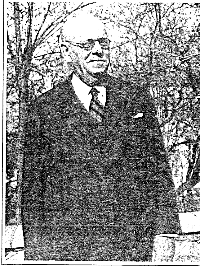
Suphi Ziya Özbekkan