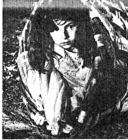
Tanınmış çocuk romanları yazarı Kemalettin Tuğcu'nun bir çok eseri de yerli filmlere konu olmuştur. Bunların içinde en ünlüsü, ilki 1960 yılında çevrilen «Aysecik» serisidir.