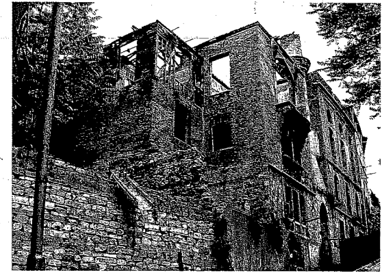
Buhara Özbekler Tekkesi'nin restorasyon başlamadan önceki harap hali.

Özbeklerde de, Mevlevilerde ve Bektaşilerde Ahilikte olduğu gibi teşkilât göze çarpıyor. Diğer tarikatlar da bu teşkilat mevcut değildir. Türkistan'dan, Hindistan'dan kafilere her sene İstanbul yoluyla Hacc'a gitmek üzere gelen Türkler İstanbul'da kendi tekkelerinde, tıp kalkarlar ve ekseri bıçak bileyiciliği ve kırılmış kâse, tabak, bardak kenetçiliği yaparak, hilâl (yani kürdan), sakal tarağı, misvak gibi şeyler satarak geçinirlerdi."