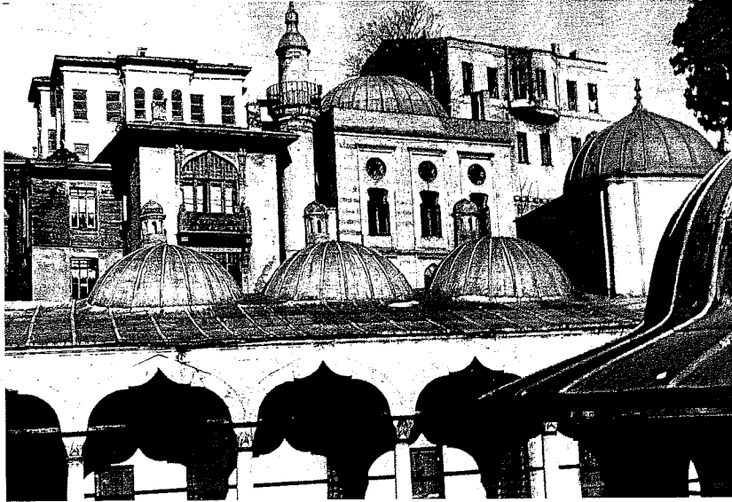
Kadirga'daki önemli tasavvuf merkezlerinden Buhara Özbekler Tekkesi, 1930'larda, öğrenci yurdu olduğu senelerde.

Bu yazının konusu olan Özbek tekkesi Kadirga'da ve Şehid Mehmed Paşa Yokuşu üzerindeki Buhara Özbekler Tekkesi'dir. Diğer Özbek tekkeleriyle beraber Buhara Tekkesi Asya'dan İstanbul'a gelen Müslüman dervişlerin, seyyahların ve misafirlerin şehirdeki konaklama sürelerini geçirdikleri ve ağırlandıkları merkezlerdendi. Nakşibendi tarikatına bağlı olan bu tekkelerde tarikatın gerekleri yerine getirilir, ayin günlerinde zikir yapılır, ayrıca tekke bünyesindeki mescitlerde beş vakit namaz ibadeti yerine getirilirdi.