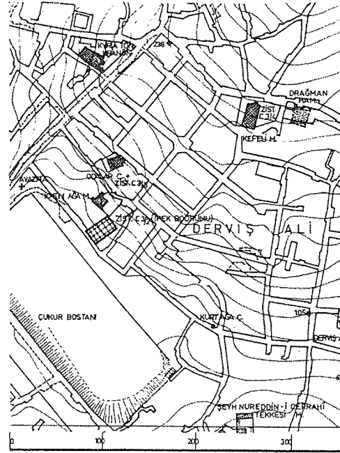
Bölgedeki yapıların yerlerini gösteren vaziyet planı (Müller-Wiener'den)

En son olarak, Sultan IV.Murad (1623-1640) döneminde iki küçük Bizans yapısı yeni fonksiyonlarına kavuşmuştur ki, bunlar Odalar ve Kefeli mescitleridir. Yine XVII. yüzyılda mescide çevrildiği, Hadikatü'l- Cevami'den öğrenilen Şüheda Mescidi de, Şeyhülislâm Hüseyin Efendi tarafından bir Bizans yapısından mescide dönüştürülmüştür. Hüseyin Efendi 1043 (1633-34) yılında idam edilmiştir. Ancak Karagümrük bölgesinde olan bu mescid hiç bir iz bırakmadan yok olduğundan, hatta yeri bile bilinemediğinden, bu yazıda üzerinde durulmamıştır.