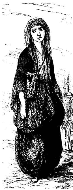
Okuldan dönen Türk kıza

1824/25 tarihinde II. Mahmut tarafından yayınlanan "talim-i sıbyan" hakkındaki ferman sıbyan mektepleri ile ilgili ilk düzenlemedir. Fermanda çocukların ergenlik çağına gelmeden önce sıbyan mekteplerine gitmeleri şart koşulmakta, çocukların okula gitmeden önce işe verilmemeleri, esnafın da bu çocukları çırak almamaları gerektiği belirtilmektedir. 11 Bu ferman ilköğretimde yapılan ilk reform niteliğindeki uygulamadır.