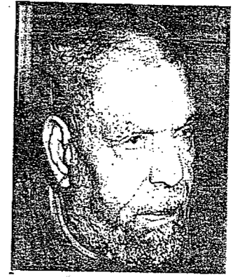
محمد متولي شعراوي (١٩١١-١٩٩٨)

محمد بن مصطفى بن علي المرزوقي، علم من اعلام تونس، شاعر، قصاص، باحث، محقق، مناضل وطني. ولد في الثاني والعشرين من ايلول