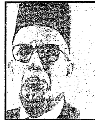
محمد المرزوقي (١٩١٦-١٩٨١)

محمد بن مصطفى بن علي المرزوقي، علم من اعلام تونس، شاعر، قصاص، باحث، محقق، مناضل وطني. ولد في الثاني والعشرين من ايلول