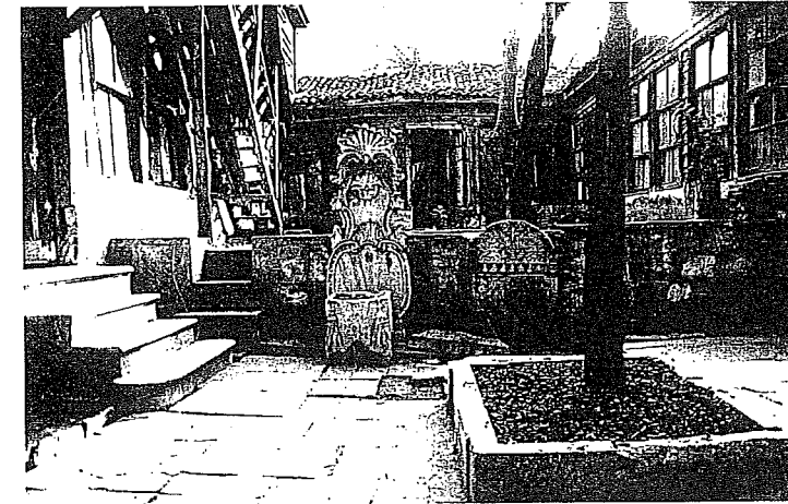
Tâhir Ağa Tekkesi avlusu

Mustafa Koç, Revnakoğlu'nun İstanbul'u: İstanbul'un iç tarihi: Fatih, c. 2, İstanbul: Fatih Belediyesi, 2021. İSAM DN. 293771