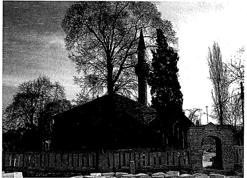
Caminin genel görünümü. / General view of the mosque.

Cami 1,15 m kalınlığında kesme taş ve iki sıra tuğla dizileriyle inşa edilmiştir. İç ölçüleri 11,70x11,20 metredir. 7,75 m derinliğinde ahşap çatılı bir soncemaat yeri, caminin önünü ve kısmen de yanlarını sarmaktadır. Ön ve yan saçak alınları üçgen biçimindedir. Caminin çatısı da ahşaptır. Ancak orijinal yapısının kubbeli olduğu sanılmaktadır. Soncemaat mahallinde yer alan dört alt pencerenin kemer aynalarına konurmuş celf süslü yazıların, döneminin en güzel örneklerinden olduğu söylenebilir (5). Sağda bulunan minare kaidesinin bir eşi de solda yapılarak yapıda denge sağlanmıştır. Caminin zarif ve mütenasip minaresi kesme taştan, çok kenarlı bir gövdeye sahiptir ve şerefesinin altı mukarnaslıdır.