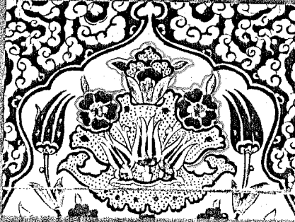
Kapak: Takyeci Camii'nden

Dizgi: BBA Dizi Servisi Osman Tulu - Tel: 528 50 17