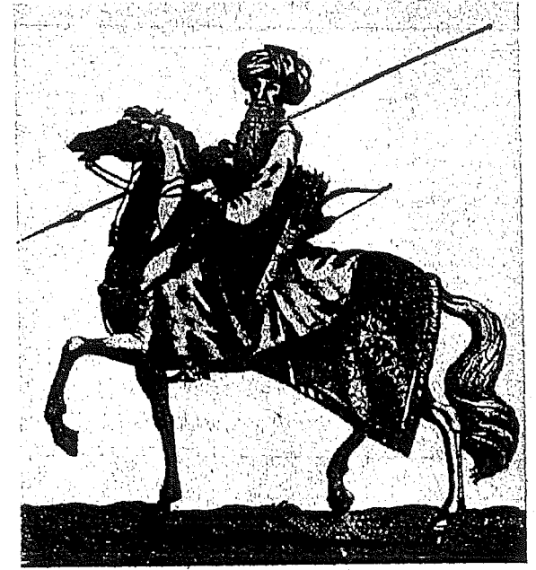
San İhsan Beylerbeyisi Abdurrahman Abdi Paşa.