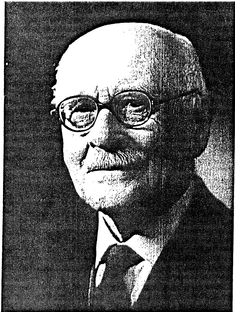
V. Minorsky 1962

Professor Emeritus in the University of London