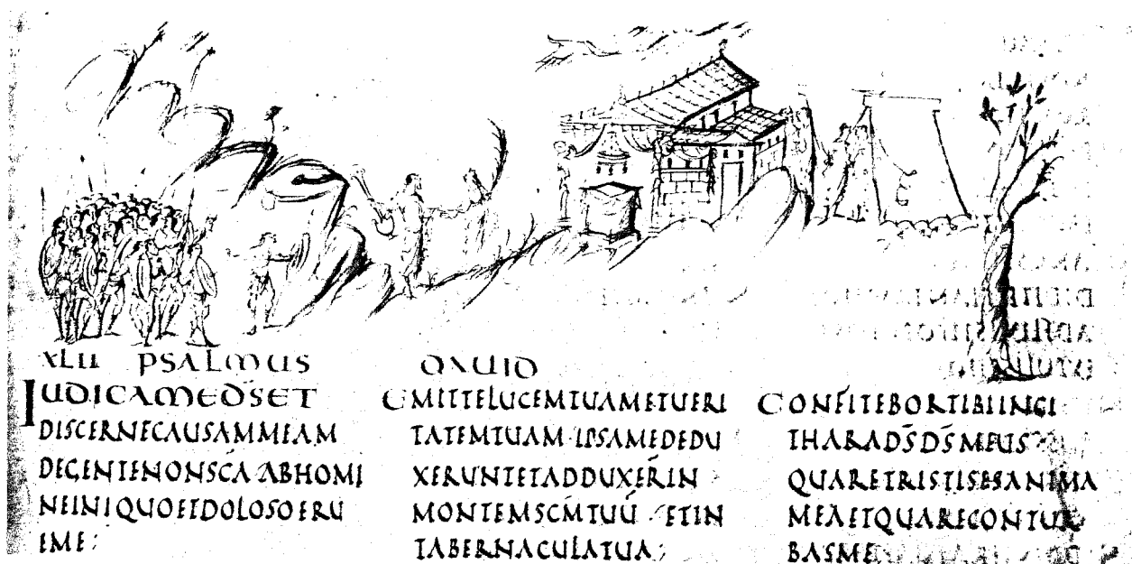
Psalm 42 (43) in the Utrecht Psalter, showing Truth and the Psalmist (with lyre), 820's. UTRECHT, BIBLIOTHEEK DER RIJKSUNIVERSITEIT, COD. 32, fol. 25r

UTRECHT PSALTER. Probably produced during the 820's in the Benedictine abbey of Hautvillers near Rheims, the Utrecht Psalter (Universiteitsbibliotheek, cod. 32) is the masterpiece of Carolingian illustration and one of the most problematic works of medieval art. Written in rustic capitals and illustrated with lively pen drawings, the Utrecht Psalter is an overtly classicizing work. The imaginative piecing together of diverse ancient images is typically Carolingian. The manuscript influenced later ninth-century art (for example, the ivory reliefs on the throne of St. Peter, Vatican), and was copied several times in England, where it was located from about 1000.