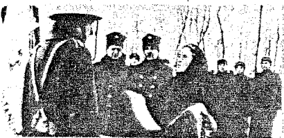
«Хəјанəт күнлэри» филминдэн кадр. Реж. О. Вавра.

ВАВРА (Vávra) Отакар (д.28.2.1911, Брно)—Чехословакия кино режиссору, сценарист, ЧССР халг артисти. Чехословакия Дəвлэт мұкафаты лауреаты (1949), 1957 илден Прагадаки Инчəсəнəт Академијасынын реж.-луг фəкултəсинин профессору. Кино сəһэсиндэ 1929 илден чалышыр. В. Чехословакия киносында монументал-тарихи филмлэрин жарыдычысыдыр. Бир чох филми халгын фашизмə гаршы вэтəнпəрвэрлик мұбаризəсинэ һəср олунмушдур. «Лал баррикада» (1949), «Јан Гус» (1955), «Јан Жижка» (1956), «Намыја гаршы» (1957), «Вэтəндаш Брих» (1958), «Корнет үчүн романс» (1966),