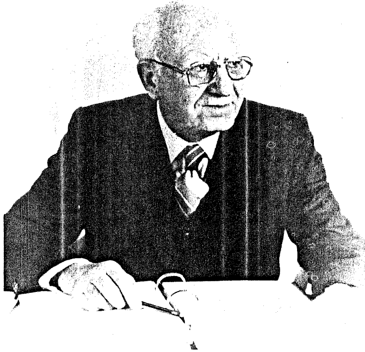
Constantine K. Zurayk