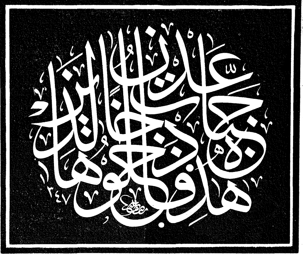
Halim Efendi'nin 1347 H. (1928) yılında yazdığı sülüs celisi bir âyet istifi.

Eylül 1964 günü, Tıp Tarihi Enstitüsünde, ilk üstadı Hamid Beyin de bulunduğu bir toplantıda, merhumun bunu bertafsil anlatışı ne hazin bir tesadüfdür!