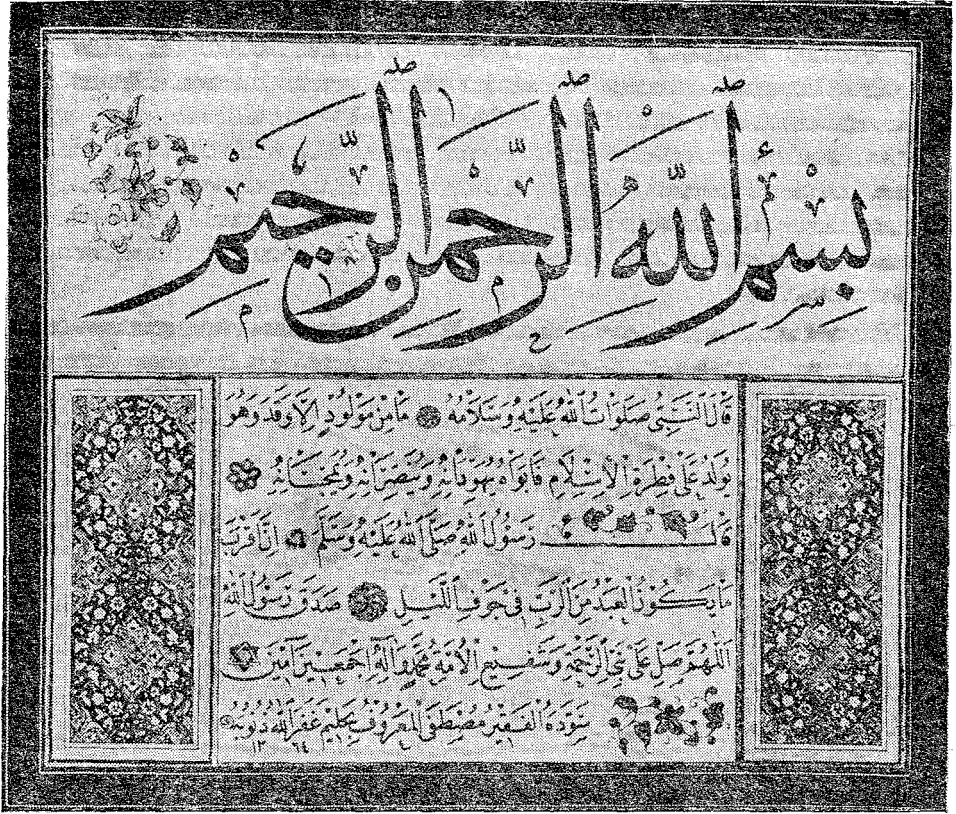
Merhumun 1364 H. (1944) de yazdığı «muhakkak» hattı ile Besmele ve «nesih» hattı ile bazı Hadis-i Şerifler

Kendi rivayetine göre, burayı bağ yapacağını söyleyince, kapı karşı komşusu Arnavut bahçıvanlar, müstehzi bir eda ile, bu toprakda bağ olamayacağını söylemişler. «Halim yapsın da siz görün» diyerek bir girişmiş, yirmi bir dönümlük yerin duvarlarını ailesiyle beraber örüp, on dönümünde üç bin kütüklük bir bağ yapmış ve otuz çeşit kadar üzüm yetiştirmiştir. Çavuş, misket, razakı, Erenköy siyahı, nur-i nigâr, pembe çavuş, Hacı Balbal, Hacıoğlu siyahı, Beyrut hurması, İskenderiye misketi, Hamburg misketi, kabak üzümü, Amasya üzümü... «Bağ olmaz» diyen komşular hayrette, Halim müftehir... Azmini göstermek cihetinden bu hâdiseyi bilhassa yazdım.