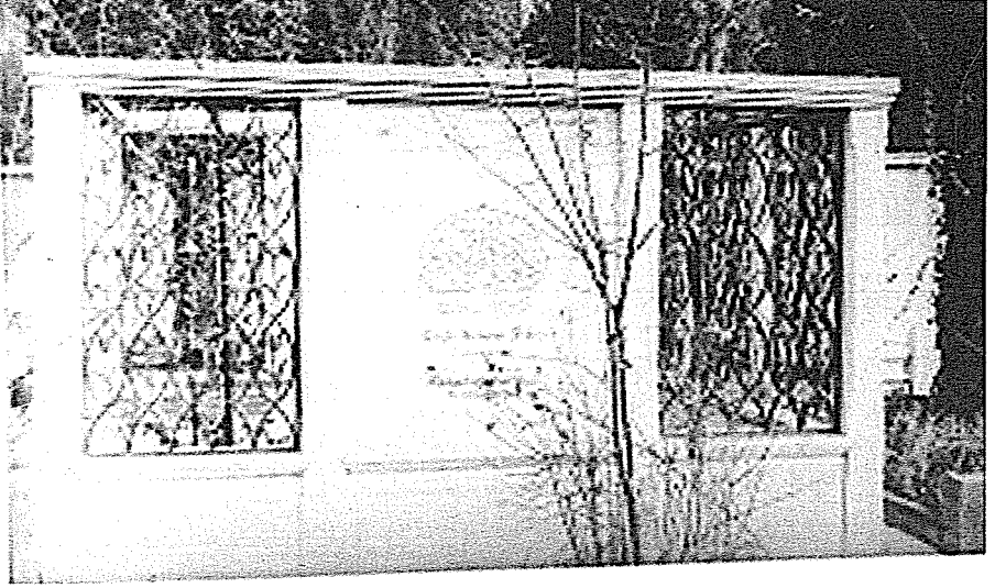
Kenan Rifâî'nin kabri.

–Çalgı refâkatinde ilâhî okumakta bir hatâ var mıdır? şeklindeki soruya şöyle cevap verir: